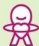
Hart en ziel

Met hart en ziel en ondernemend vakmanschap werken we samen aan warme, kleinschalige en mensgerichte zorg, waarin de cliënt tot bloei komt.